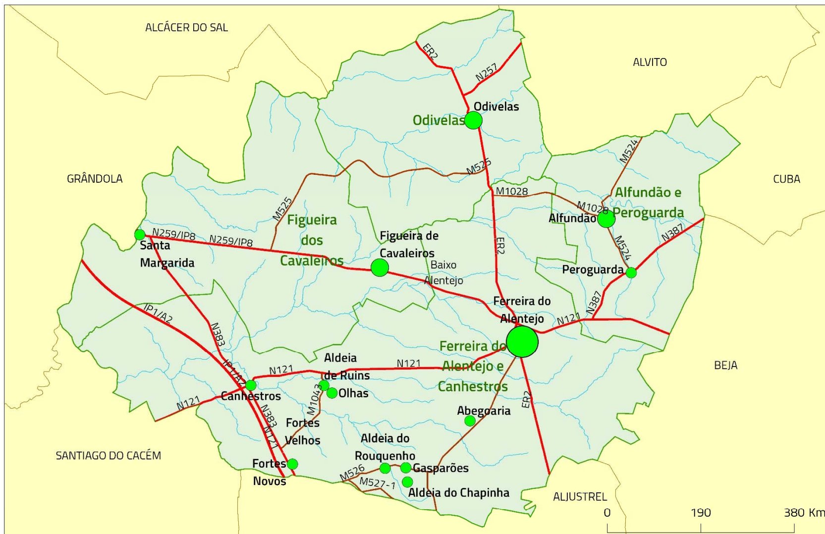
Figura II.1.1. Enquadramento territorial do concelho de Ferreira do Alentejo