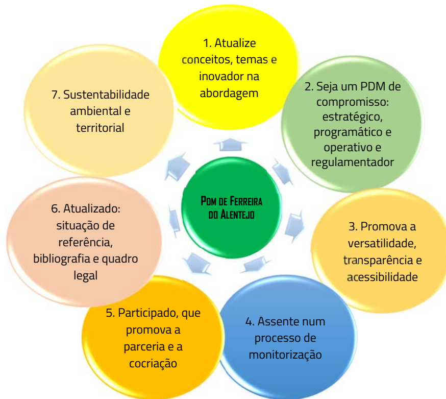
Figura I.4.1. Linhas orientadoras da revisão do PDMFA